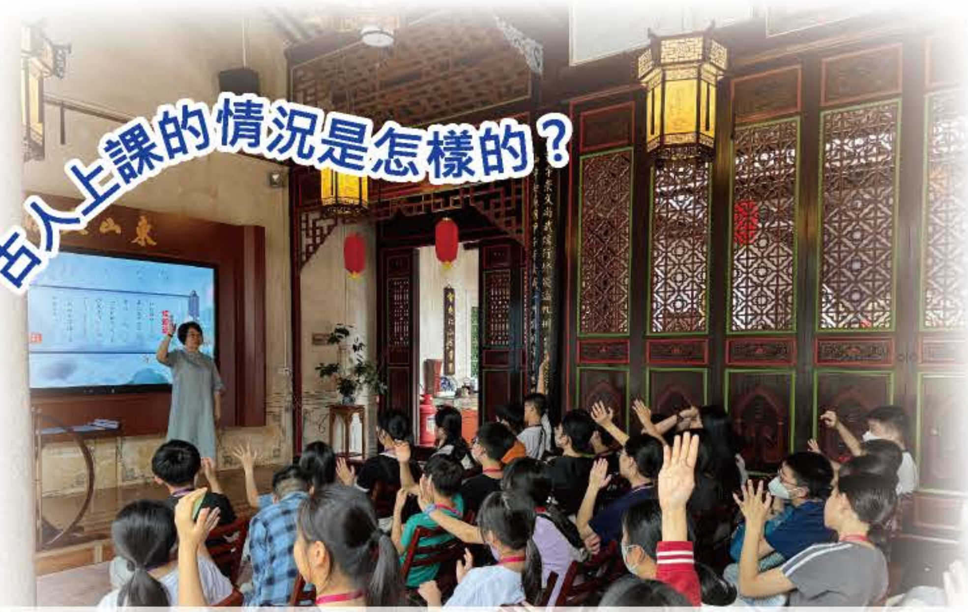
就讓我們於東山書院來體驗一下吧！