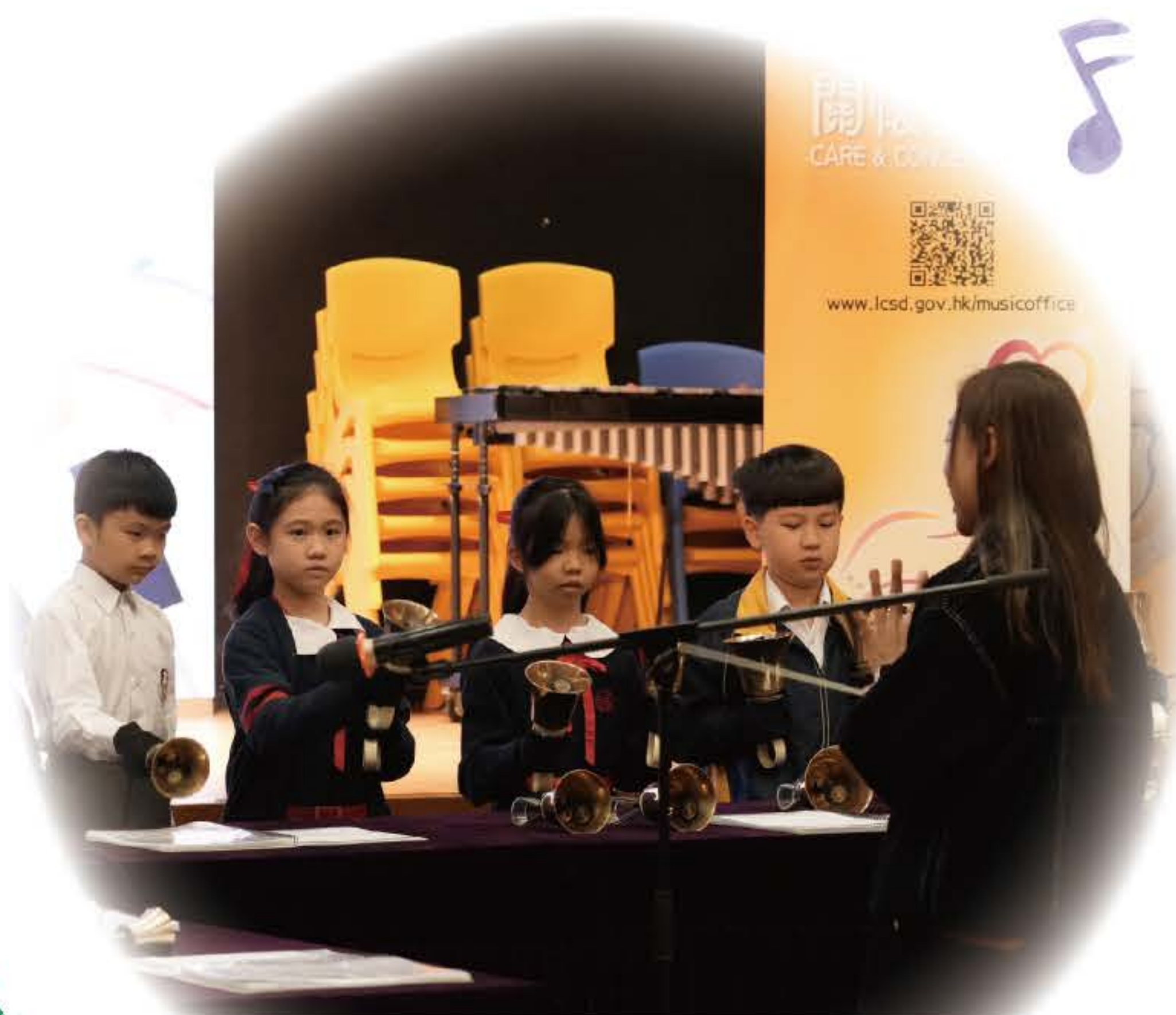
中級組手鈴隊成員由小二至小四同學組成，雖然年紀小，演出亦有板有眼。