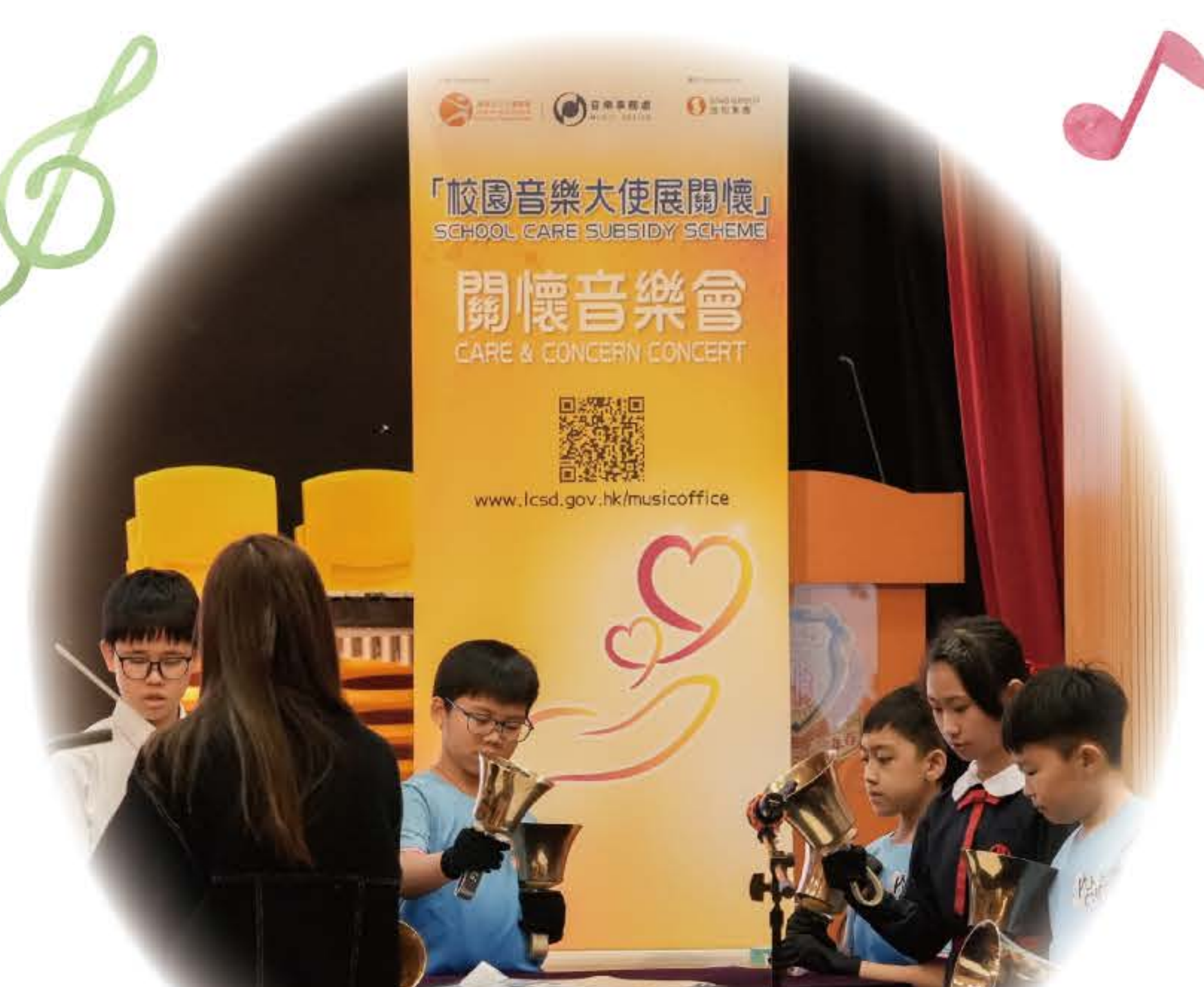
高級組手鈴隊正演奏一曲「快樂頌」，將快樂帶給在場人士。