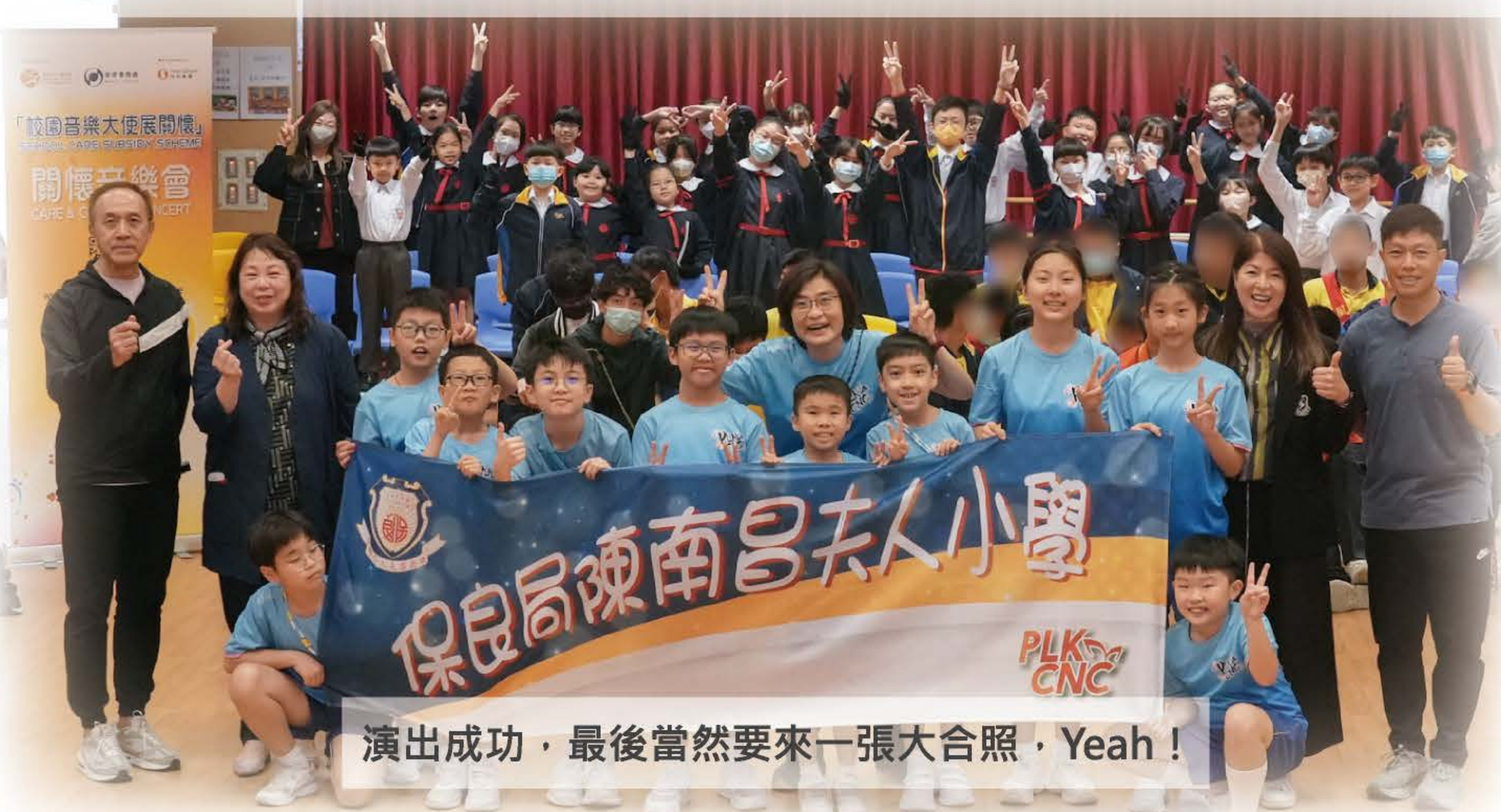
演出成功，最後當然要來一張大合照，Yeah！

本年度學校再度參與由音樂事務處、康樂及文化事務署及信和集團等機構合辦的「校園音樂大使展關懷」計劃。本校挑選了合唱團、手鈴隊及花式跳繩隊的學生組成「校園音樂大使」，並於2024年2月23日在保良局陳麗玲(百周年)學校舉行「關懷音樂會」。是次活動讓本校特別甄選的「校園音樂大使」表演，以音樂彼此分享、互相交流，讓他們感受到友校學生的藝術天分。此外，兩校學生更一起玩「音樂傳球」及「跳大繩」遊戲，其後百周年同學以手鈴打奏一曲「Twinkle Twinkle Little Star」，大家都樂在其中。