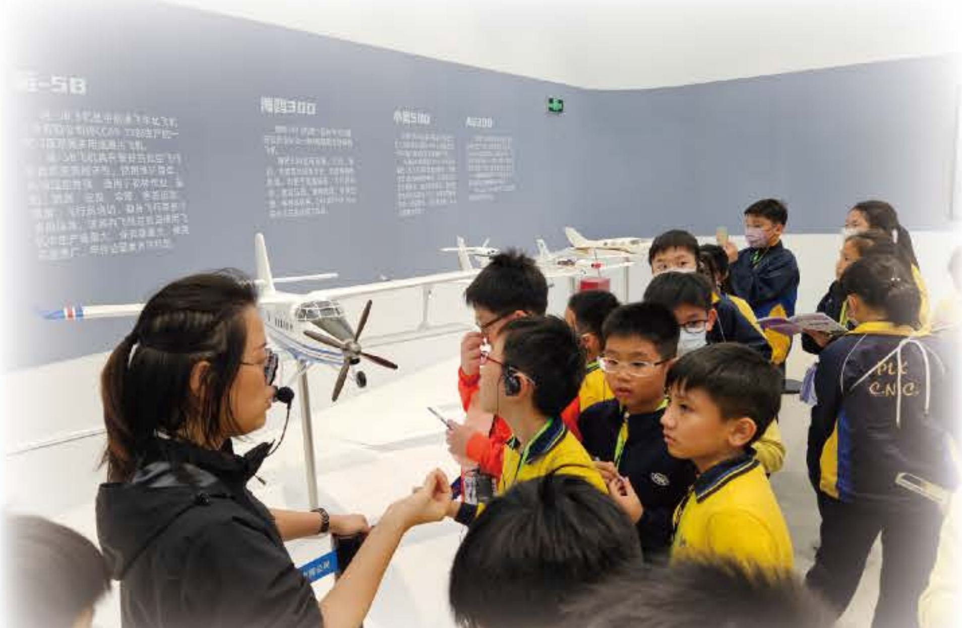
大家正在專心聆聽導遊講解我國的航空發展史。