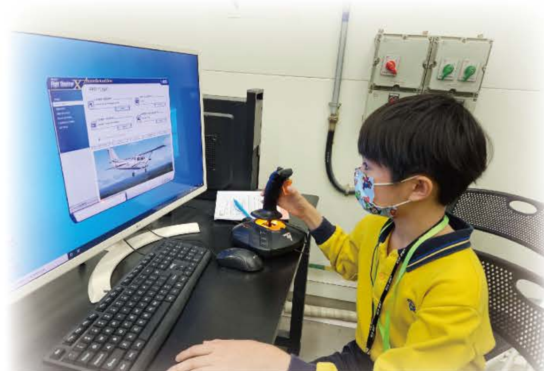
我們都當上機長，進行飛機模擬駕駛訓練。