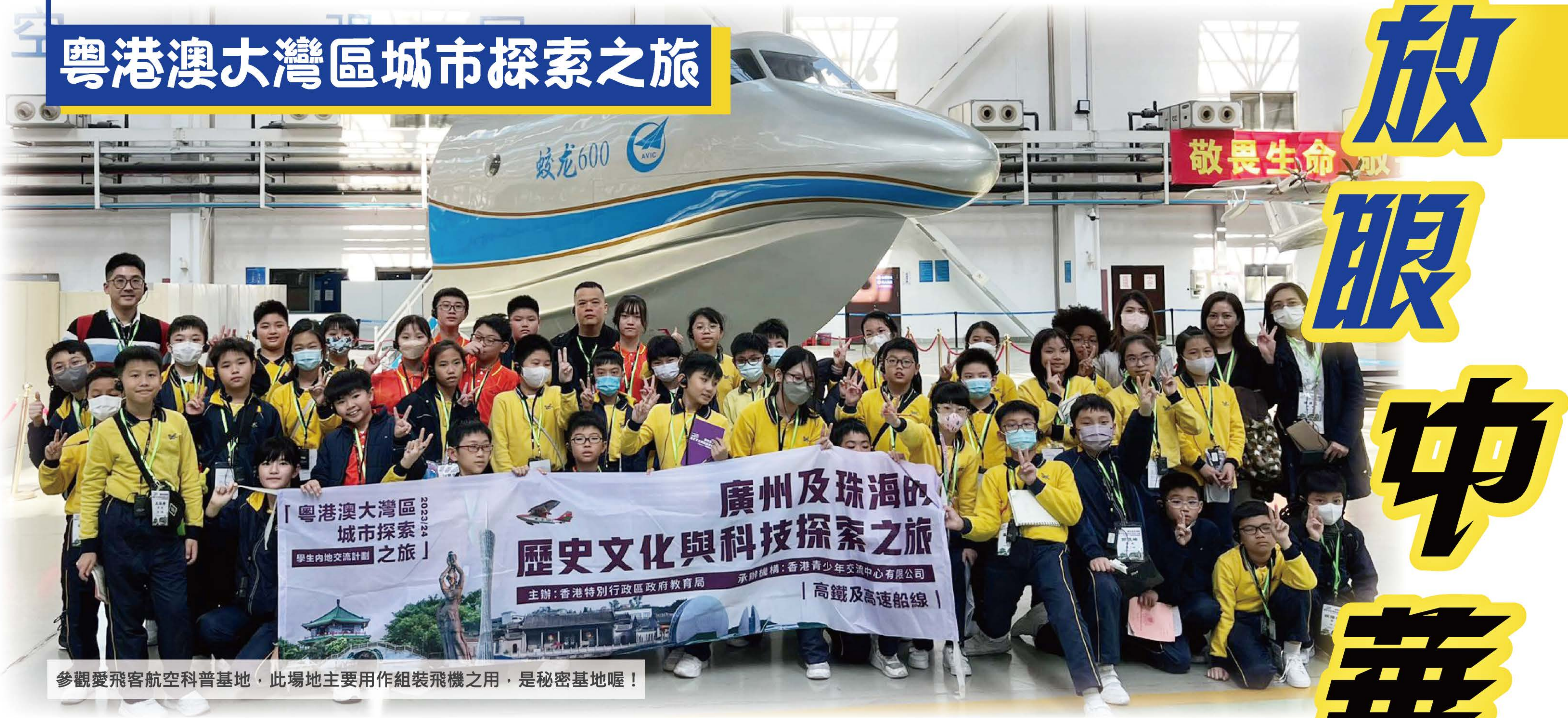
參觀愛飛客航空科普基地，此場地主要用作組裝飛機之用，是秘密基地喔！