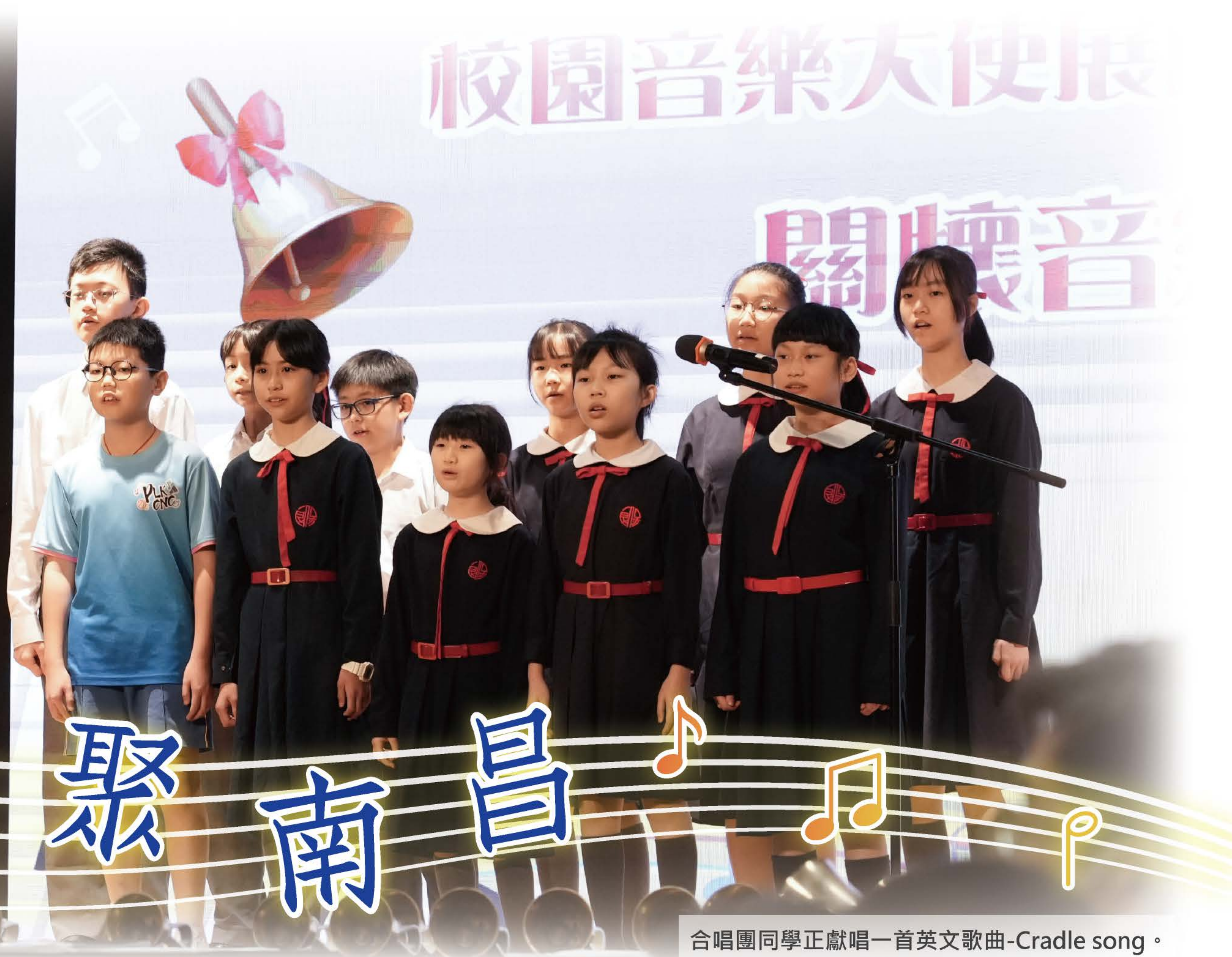
合唱團同學正獻唱一首英文歌曲-Cradle song。