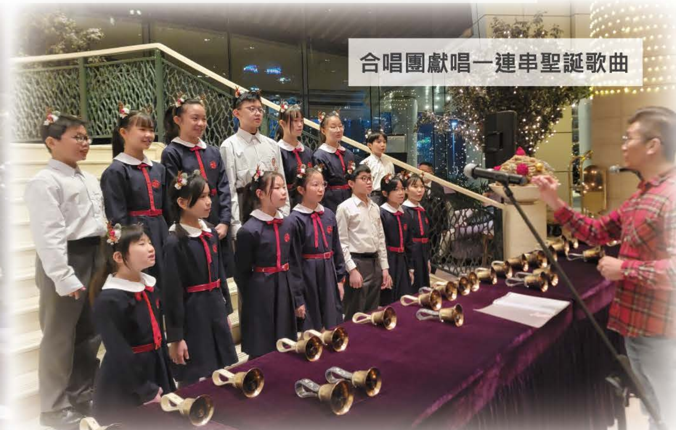
合唱團獻唱一連串聖誕歌曲