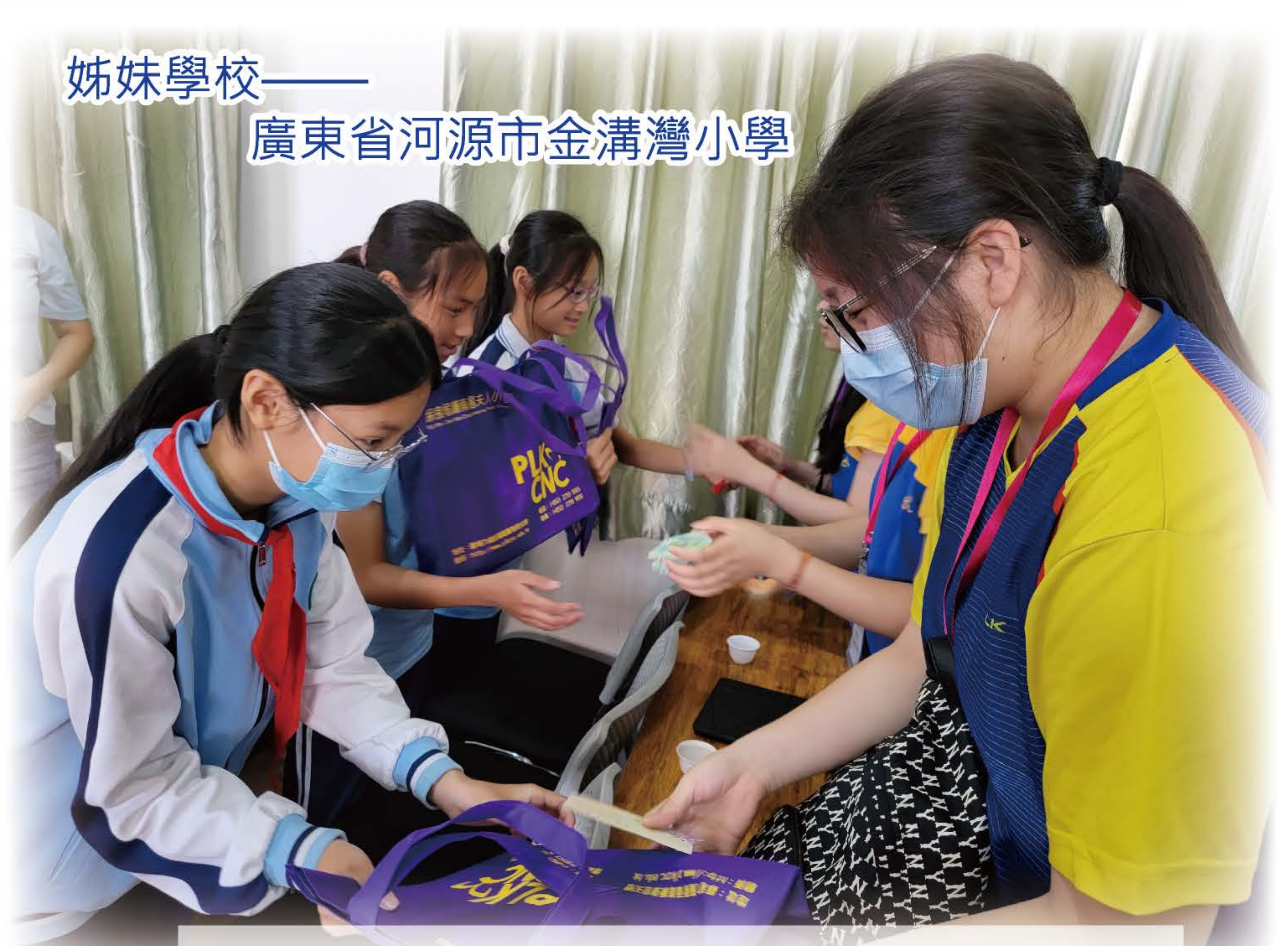
師生們到訪內地姊妹學校「廣東省河源市金溝灣小學」，與內地學生進行交流活動。