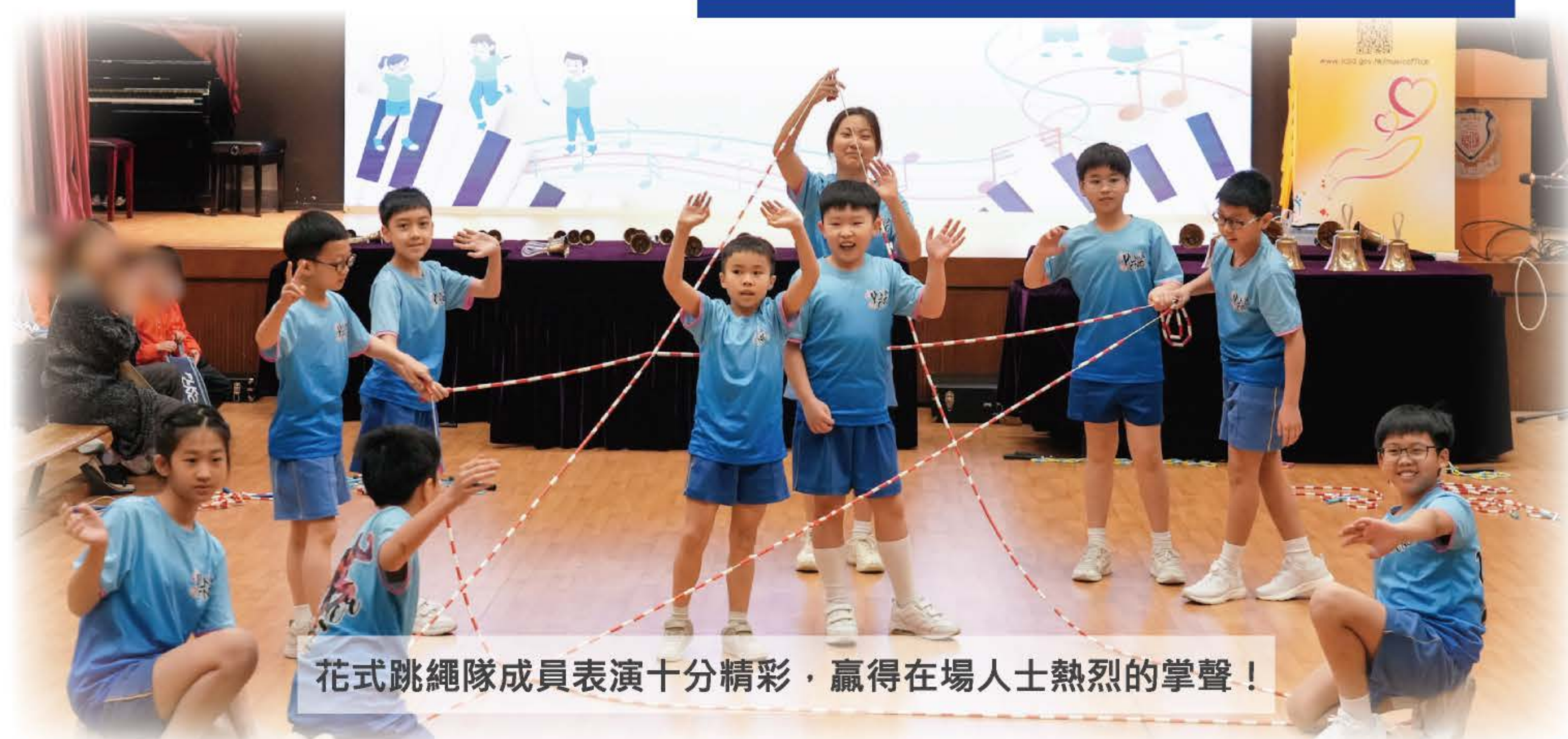
花式跳繩隊成員表演十分精彩，贏得在場人士熱烈的掌聲！