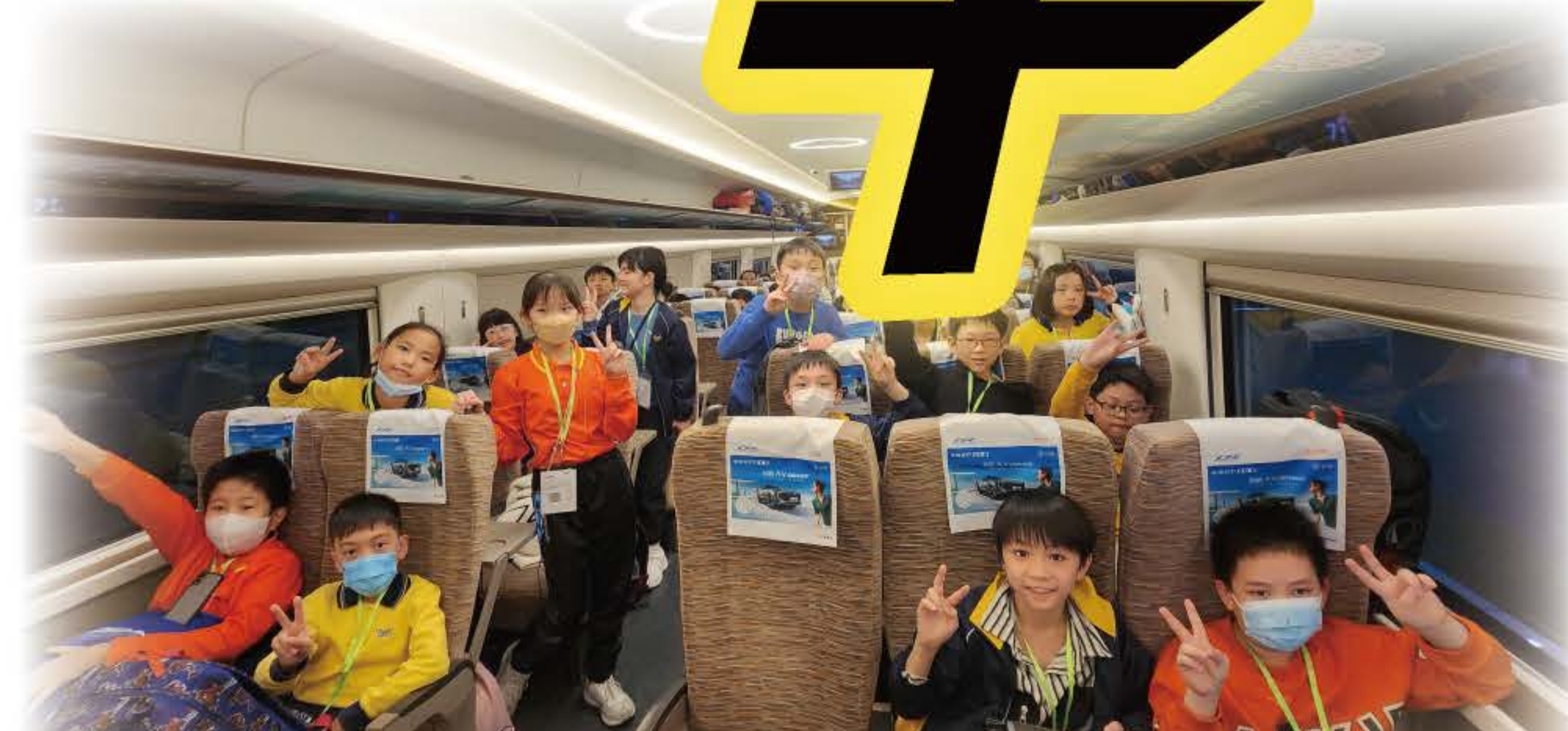
我們乘坐高鐵返回香港，全程只需45分鐘而已！