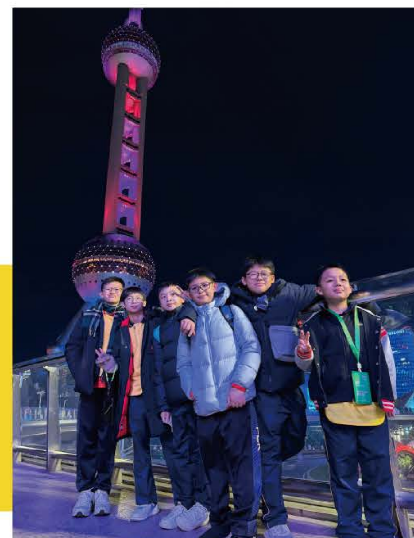
賽後，我們一起遊覽上海明珠塔。