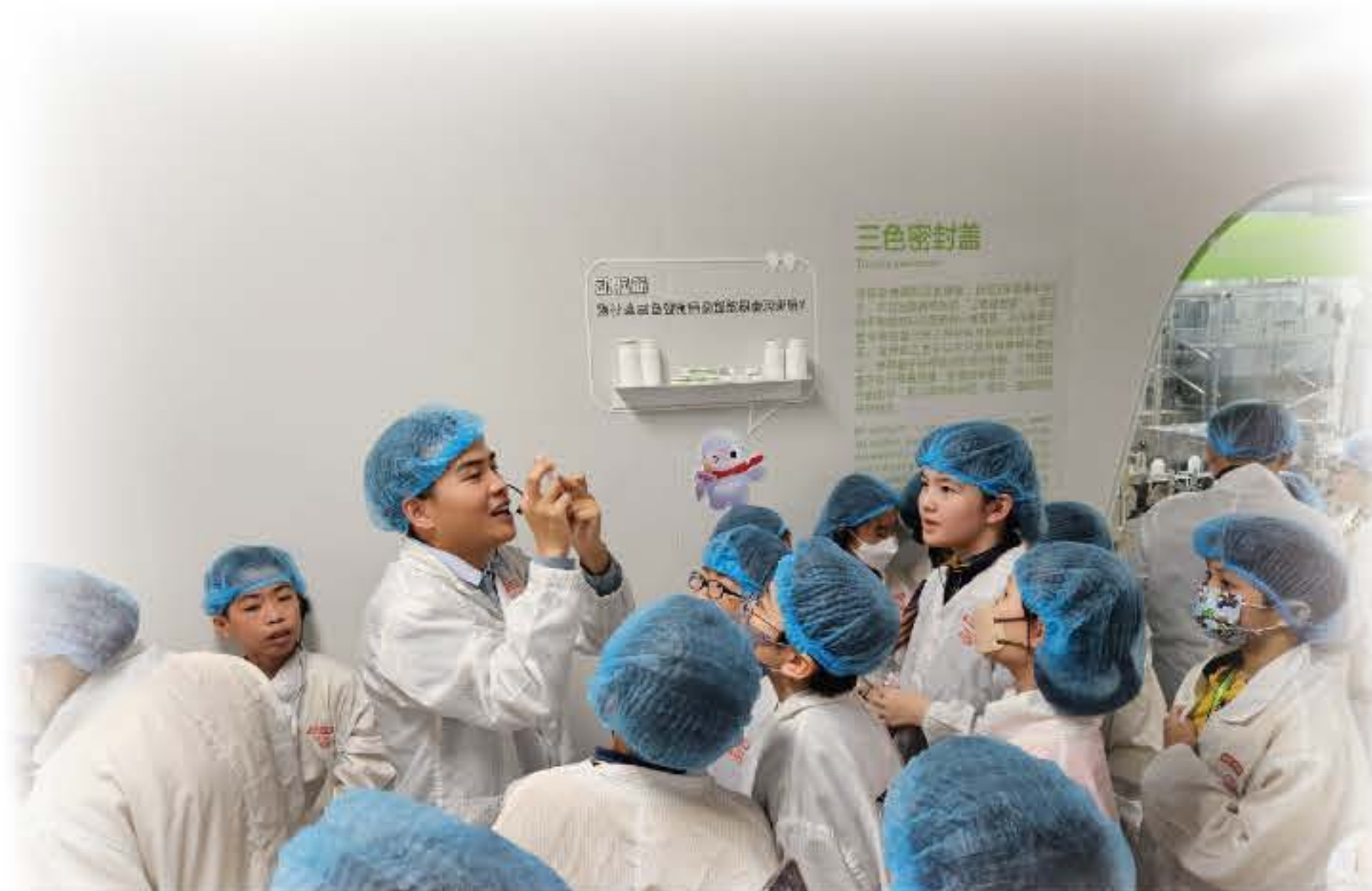
我們參觀了創新科技企業，那裏是無菌空間，所以大家都要穿上經過高溫消毒的防菌套裝。