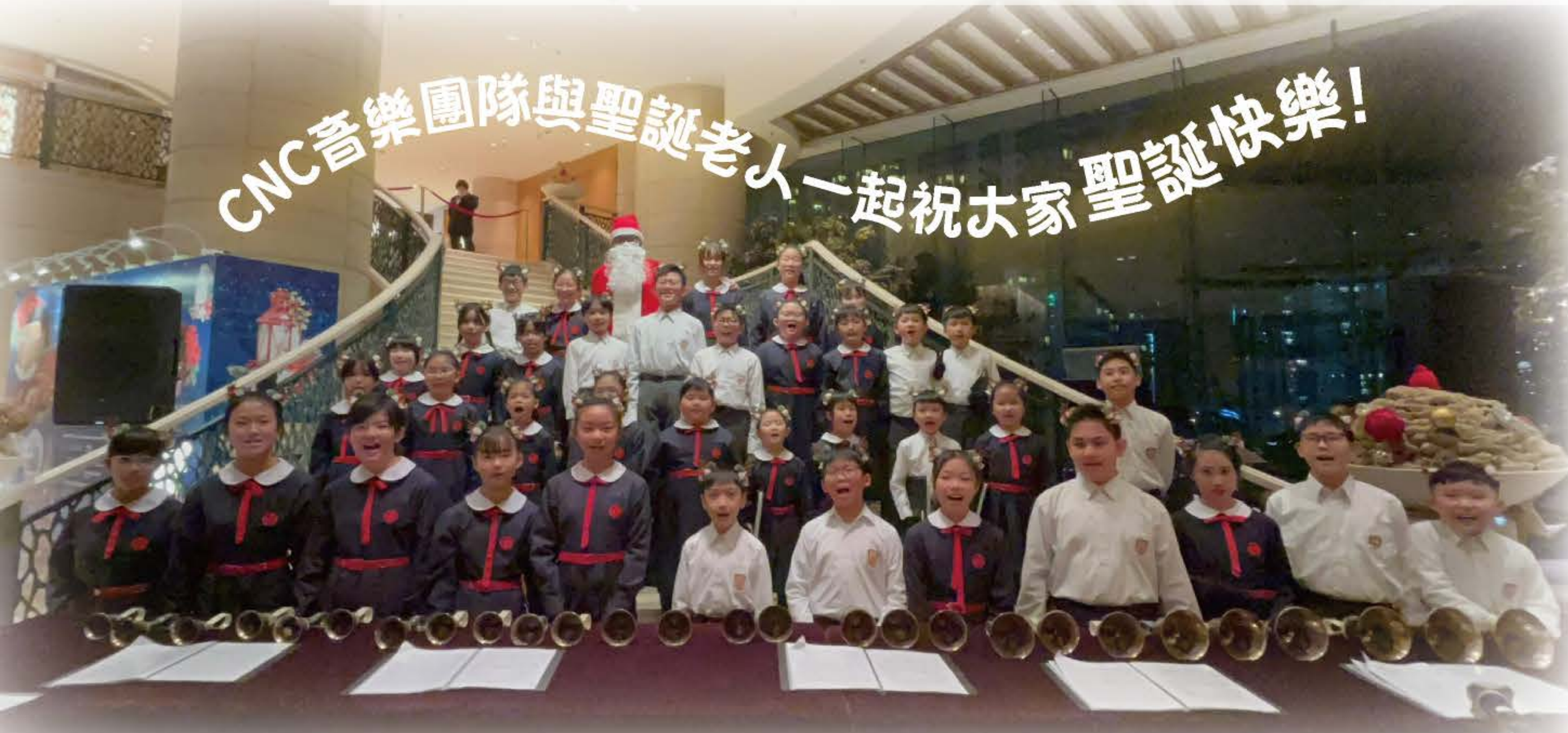
CNC音樂團隊與聖誕老人一起祝大家聖誕快樂！

本校手鈴合唱團獲邀於2023年平安夜到都會海逸酒店表演。雖然當日天氣寒冷，但本校的音樂團隊為在場人士獻上聲聲暖心的聖誕頌及手鈴合奏，以音符帶給大家無比溫暖的聖誕氣氛呢！