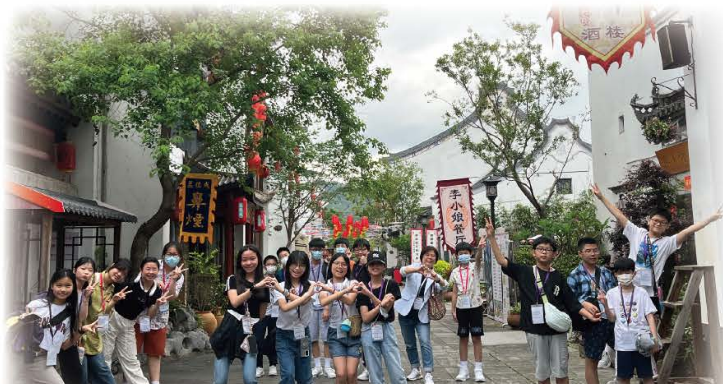
客家建築真有特色！大家都開心留影。