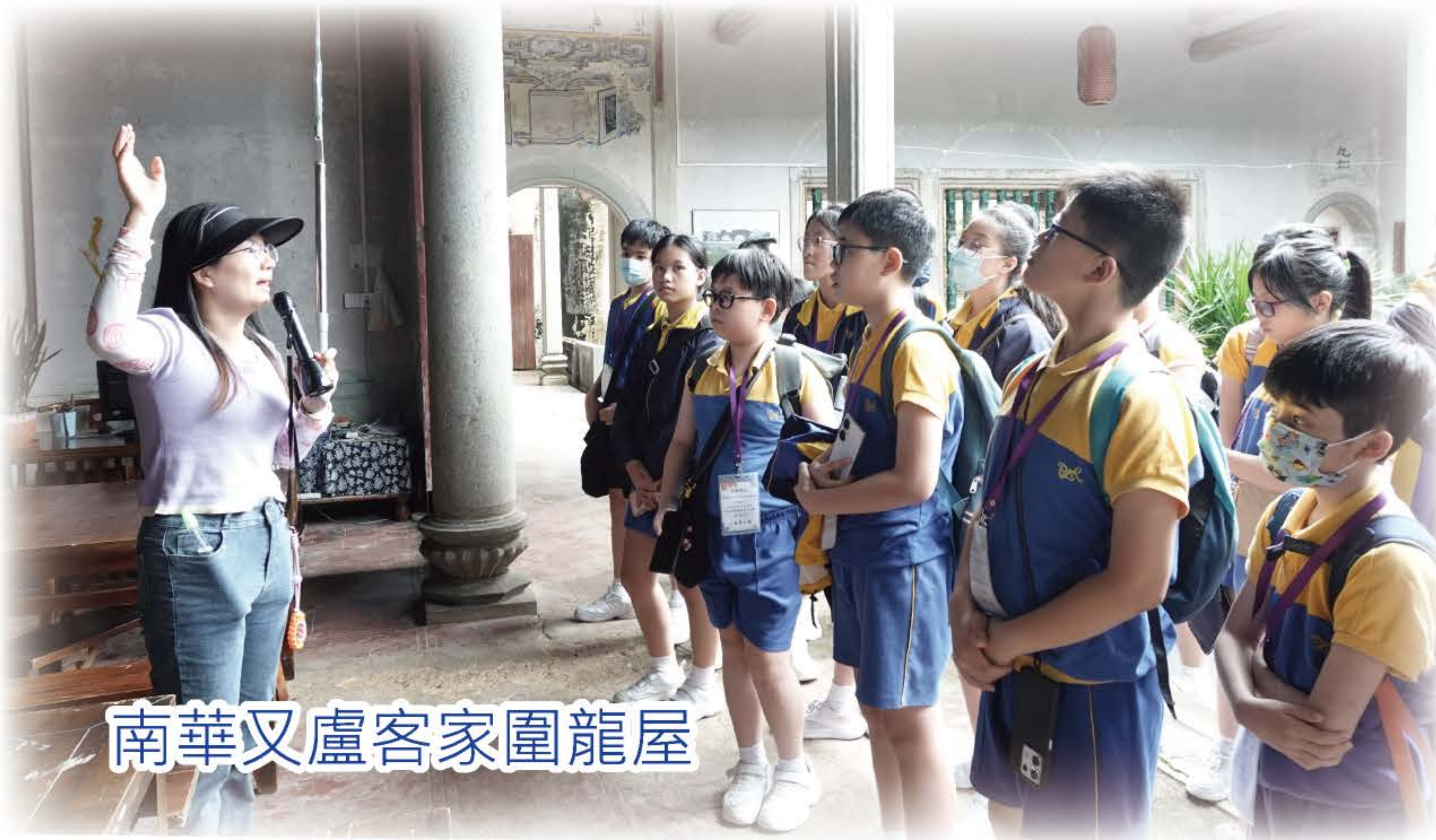
南華又盧客家圍龍屋