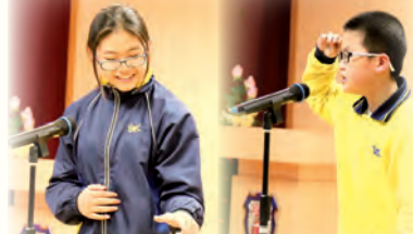
同學參加朗誦及說故事比賽，表現出色。

此外，我校亦著重學生的多元發展，鼓勵學生參加校外比賽，發掘學生不同方面的潛能，尋找自己的興趣。與此同時，為了加深同學對中國文化的了解，提升他們運用普通話的能力，每年都會舉行「中文及普通話日」。今年，除了各位老師為同學精心準備的活動外，還很榮幸邀請了保良局林文燦英文小學的學生來為我們表演普通話話劇，藉此達到同學們互相交流，彼此欣賞的學習機會。