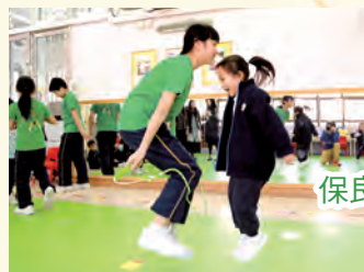
保良局王少清幼稚園暨幼兒園花式跳繩示範表演