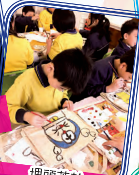
埋頭苦幹， 加添色彩。