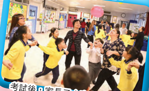
考試後，家長子女齊來鬆一鬆...!