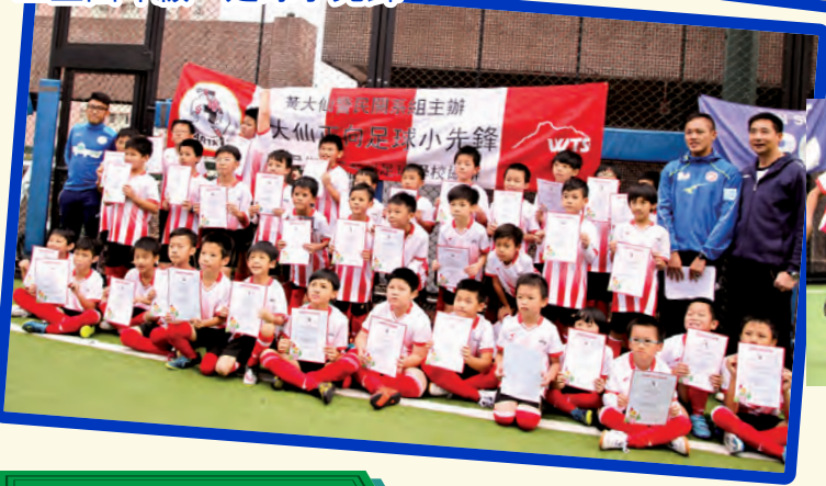
三至四年級 足球小先鋒