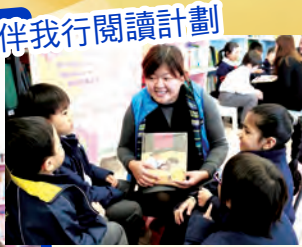
一年級 書伴我行閱讀計劃