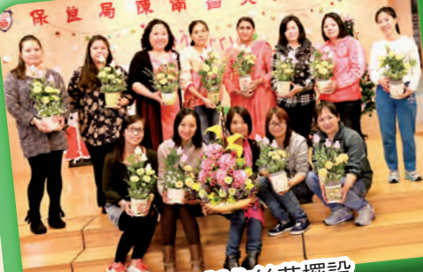
家長們一同製作絲花擺設