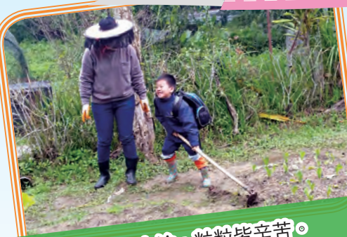
誰知盤中餐，粒粒皆辛苦。