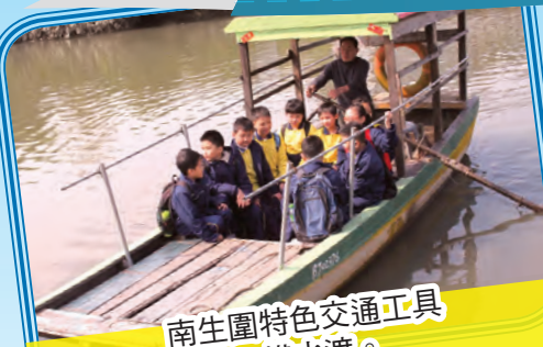
南生圍特色交通工具 —橫水渡。