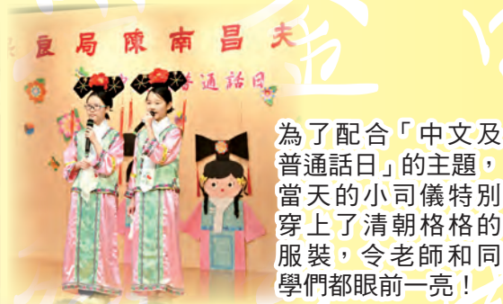
為了配合「中文及普通話日」的主題，當天的小司儀特別穿上了清朝格格的服裝，令老師和同學們都眼前一亮！