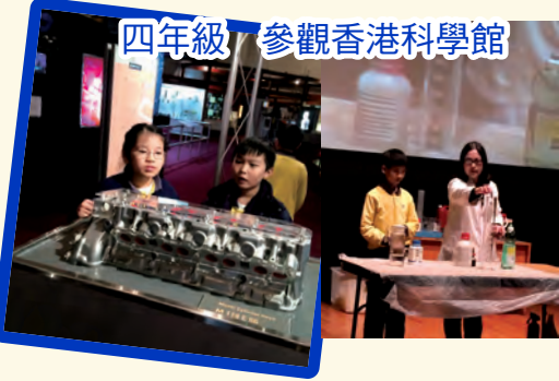
四年級 參觀香港科學館