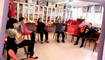
百忙中都要來學習放鬆方法