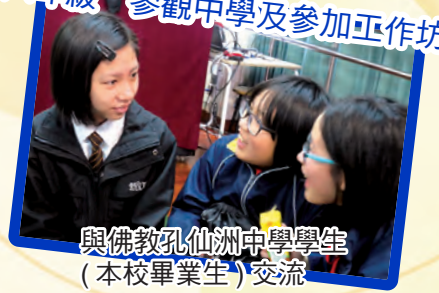
六年級 參觀中學及參加工作坊