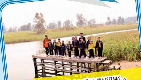
在南生圍熱門拍攝地點留影。