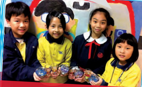
只可觀賞，萬勿飲用！