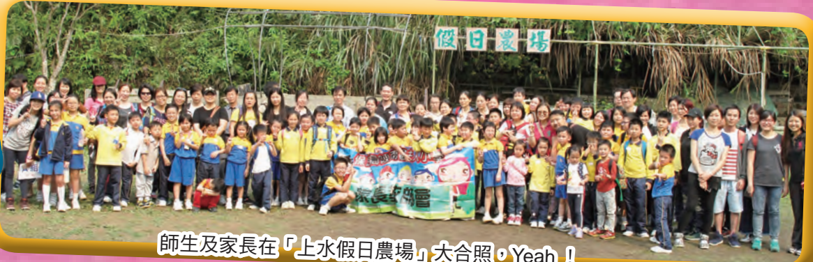
師生及家長在「上水假日農場」大合照，Yeah!