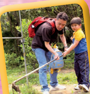
親子農耕體驗時間， 一同親親大自然!