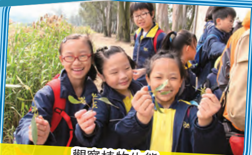
觀察植物生態， 上了一節寶貴的自然課。