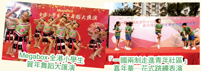
Megabox全港小學生賀年舞蹈大匯演

本校校隊除了公開比賽成績優異外，更廣受社區人士歡迎，經常獲邀到不同團體舉辦的節目中表演。