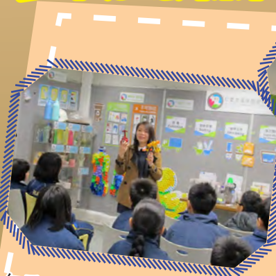
仁愛堂環保園塑膠資源再生中心