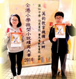
同學參加微型小說續寫大賽，發揮創意，提升他們對寫作的興趣。