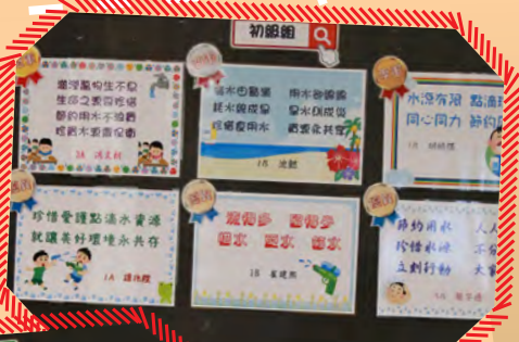
初級組、高級組 節約用水標語創作比賽