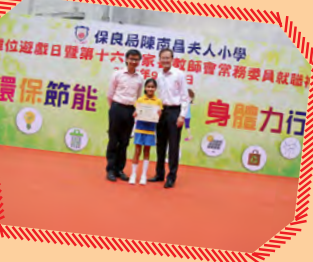
以「環保節能 身體力行」為主題的攤位遊戲日，宣揚環保信息。