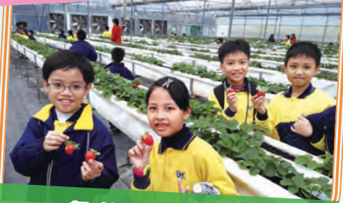
親手採摘，滋味無窮。