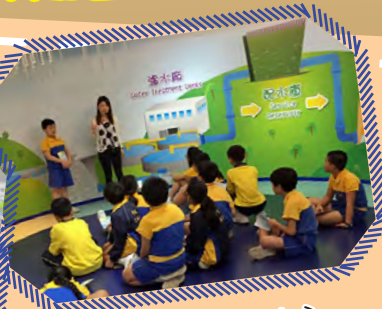
水務署水資源教育中心