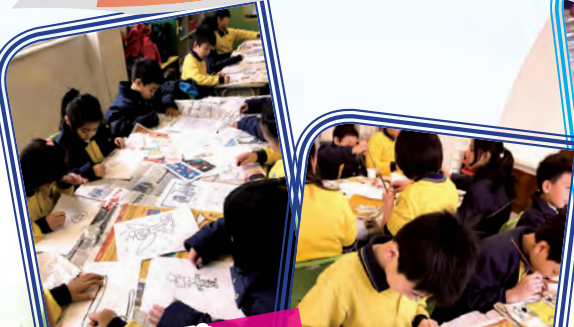
集中精神， 全力構思。