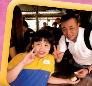
家長和子女一同發揮創意，自製麵包，好溫馨啊!