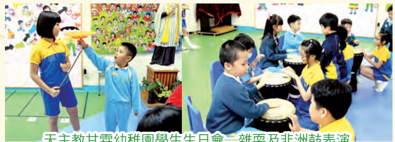
天主教甘霖幼稚園學生生日會—雜耍及非洲鼓表演