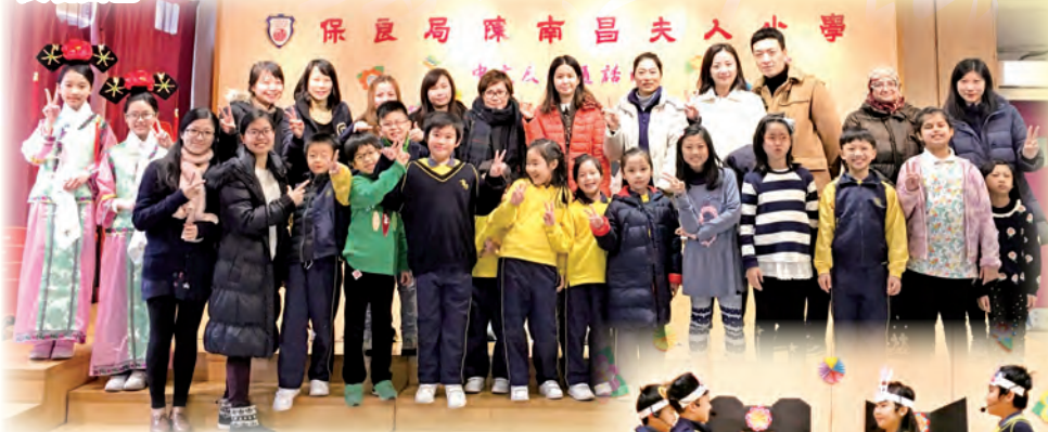
保良局林文燦英文小學學生於「中文及普通話日」為我們表演話劇，十分精彩！